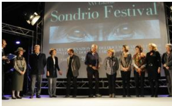
Giuria e registi del Sondrio Festival (foto d'archivio)

La manifestazione sondriese ha raggiunto diversi obiettivi importanti, ma non ha ancora raggiunto quel respiro internazionale che meriterebbe.