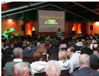
SONDRIO FESTIVAL 2012 PROIEZIONI