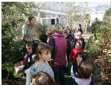
Bambini delle scuole di Sondrio in visita alla rassegna Sondrio Festival